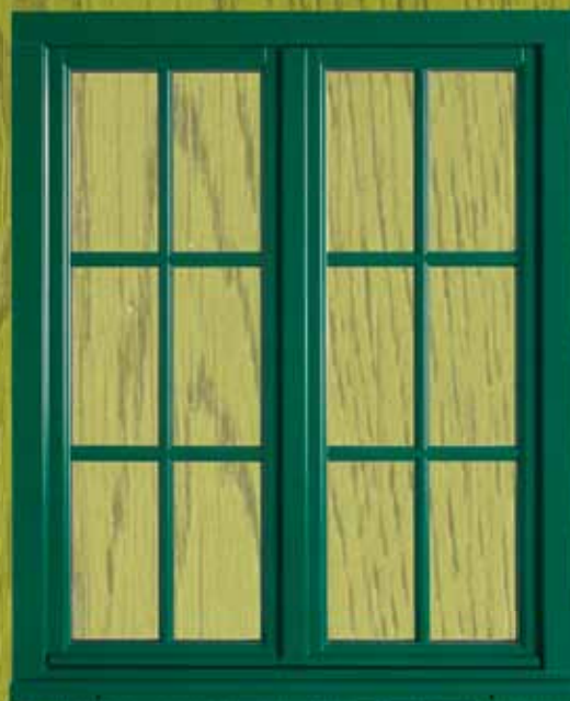
Extérieur SAPELLI Laqué

Nos menuiseries MIXTES Bois & Bois permettent de conjuguer une essence de bois différente par face. Du Chêne ou du Sapelli en extérieur et du Hêtre, du Frêne ou du Merisier pour l'intérieur.